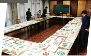
「橋の日」シンボルマーク全国公募。305点から選定。(シンボルマーク審査風景)