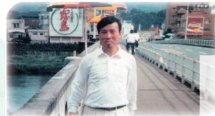
1986年8月4日、宮崎県延岡市大瀬川にかかる「安賀多橋」で行われた第1回延岡「橋の日」は大成功であった。