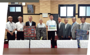
宮崎県と協働事業にて「とんとん地震」紙芝居・DVD制作。県内全小学校240校へ寄贈。