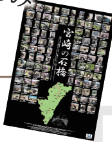
宮崎県内の石橋をまとめたポスター1000枚を製作。県内小中高へ配布。