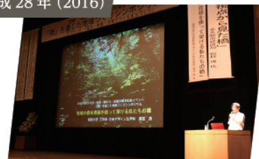
活動30周年記念事業「橋」を通じた地域づくりシンポジウム開催。250名参加。