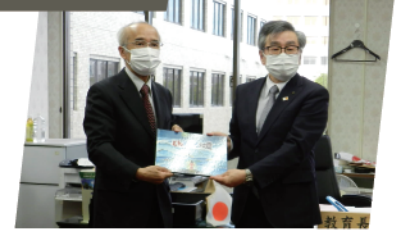
宮崎県と協働事業にて「とんとん地震」の絵本450冊を制作。