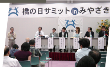
「橋の日」活動20周年記念事業「橋の日」サミット in みやざき2003を開催、180名参加。