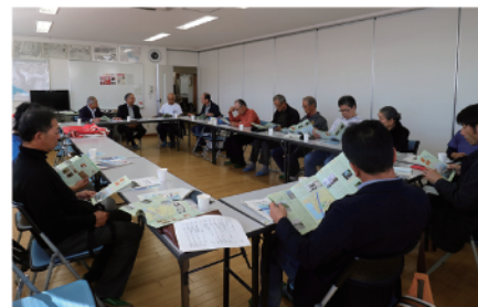
名島橋のある名島校区自治協議会の皆さんとの交流 (福岡市)