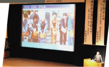
活動25周年記念事業「橋」を通じた地域づくりシンポジウム開催(250名参加)