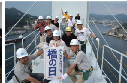
女神大橋登頂 (長崎市)