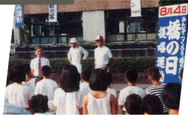
宮崎市の橋橋にて、第1回「橋の日」イベントを有志メンバーで開催。(宮崎市役所前広場にて)