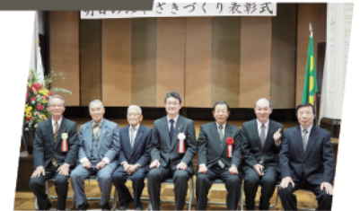
宮崎県より「明日のみやざきづくり表彰」を受ける